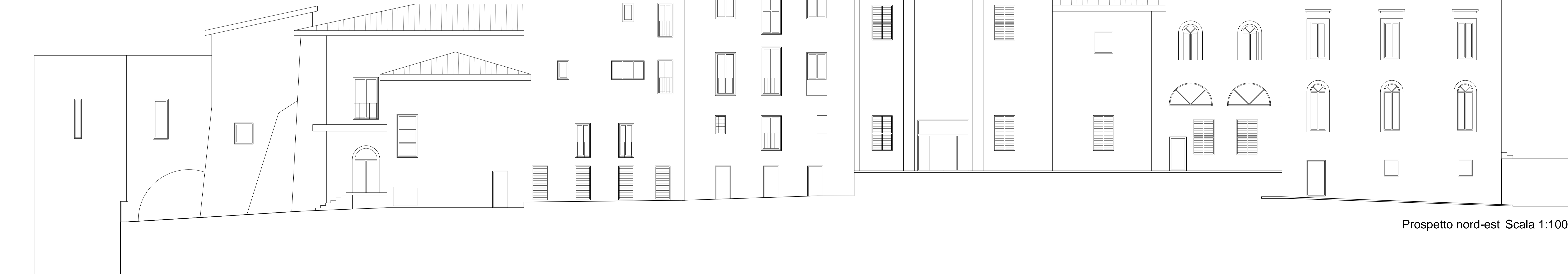
Prospetto nord-est Scala 1:100