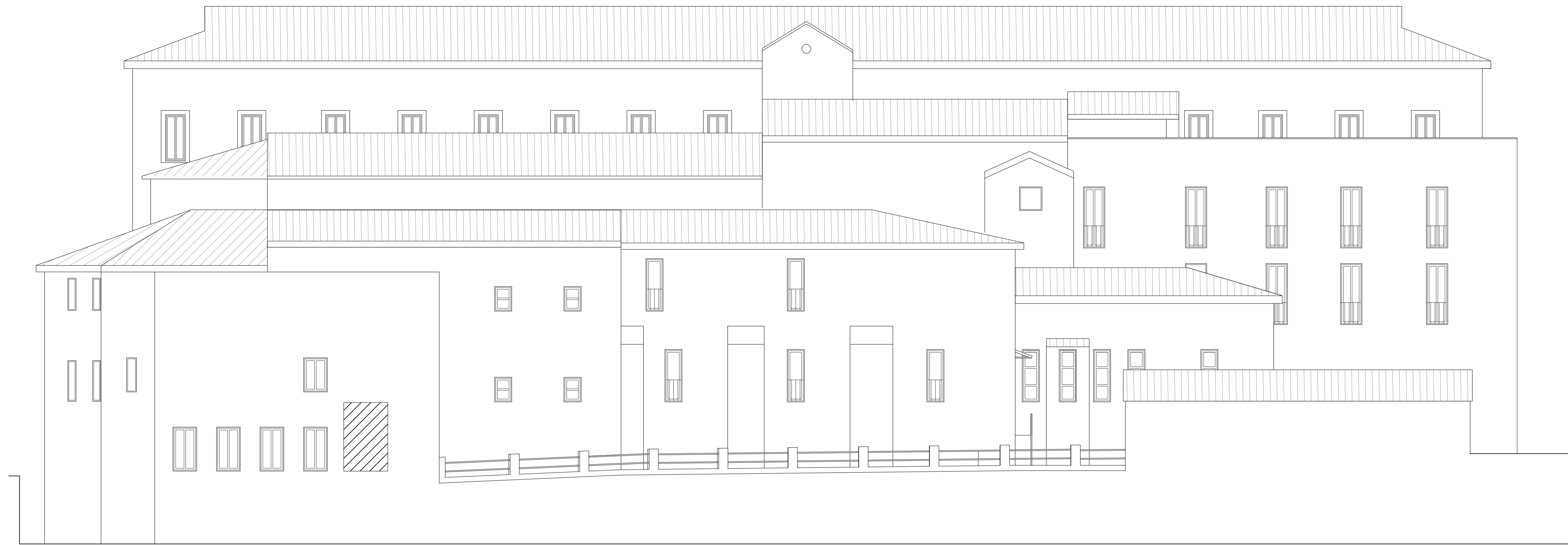
Prospetto sud-est Scala 1:100