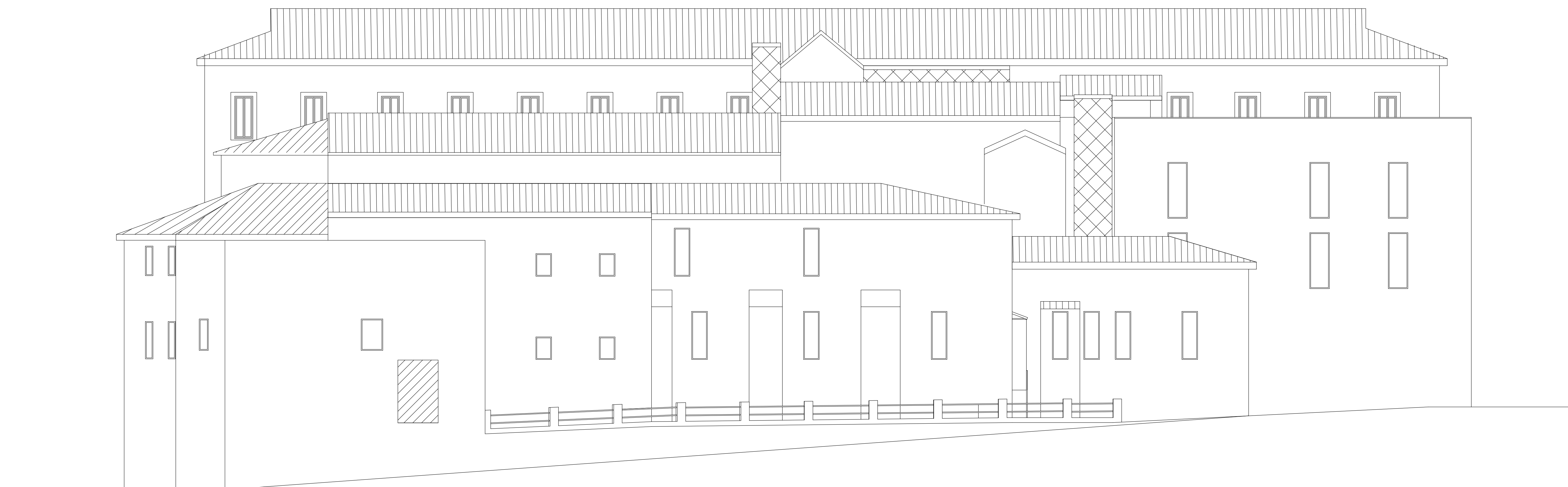
prospetto lato sud